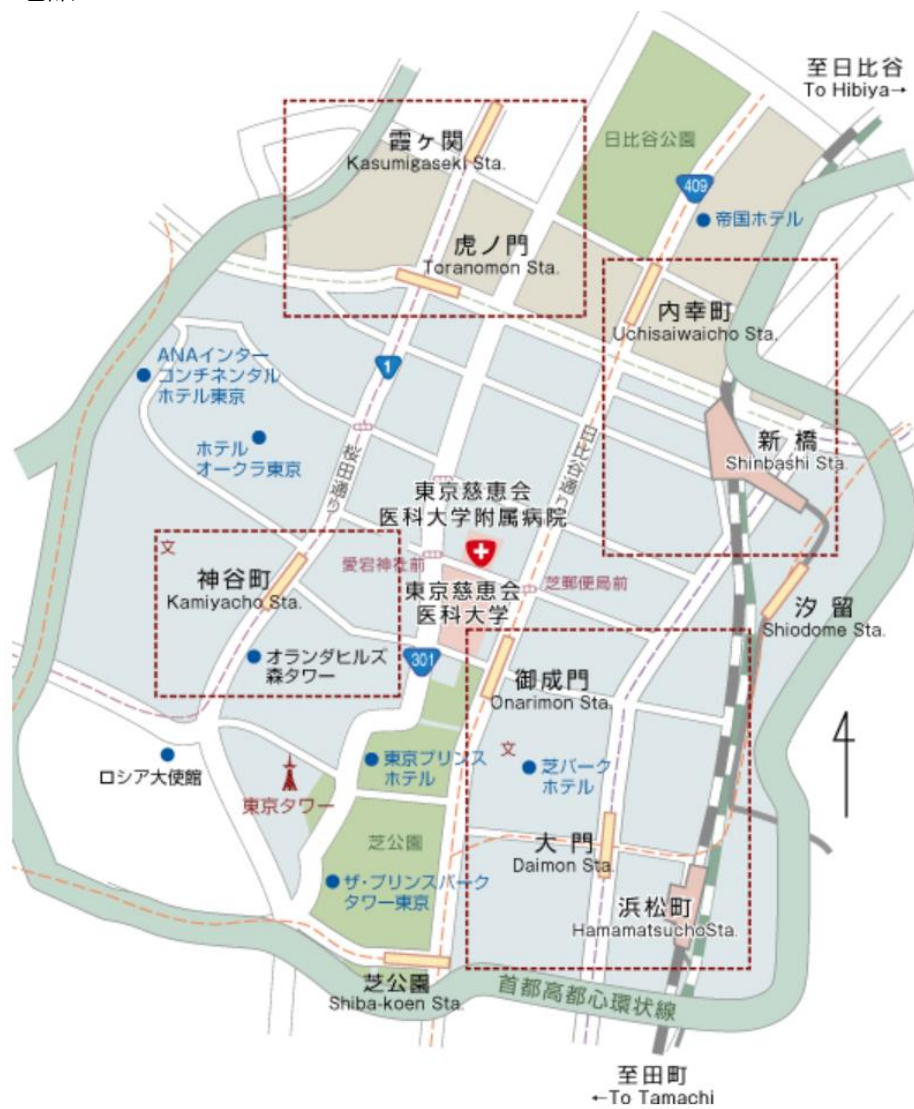
会場案内図 東京慈恵会医科大学 高木2号館

会場 東京慈恵会医科大学附属病院（本院）高木2号館南講堂 問合せ先：電話 03-3433-1111